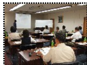
前回セミナーの様子