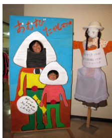
おむすびたかしマン