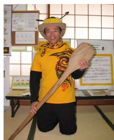
ミツバチまもり隊