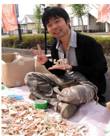
創造力無限大工房