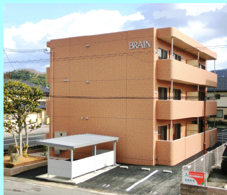
施工例) ブレインミニ 舞鶴市 2LDK×6戸

低利用地を最大限に活かす鉄筋コンクリート 造のブレインマンション。高い耐震構造と耐火 性に加え、遮音・断熱性能に優れています。