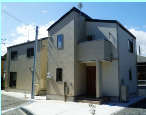
施工例) 戸建賃貸 野洲市 3LDK×2戸

小さな土地でもしっかり収益 初期投資を抑え、他物件との差別化により 高収益と安定収益を目指します。